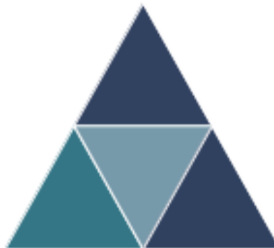
FIGURE 2: TRUE

Lorem ipsum dolor sit amet, consectetur adipiscing elit, sed do eiusmod tempor incididunt ut labore et dolore magna aliqua. Purus faucibus ornare suspendisse sed nisi lacus sed viverra tellus. Et ligula ullamcorper malesuada proin libero nunc consequat. Proin libero nunc consequat interdum varius sit.